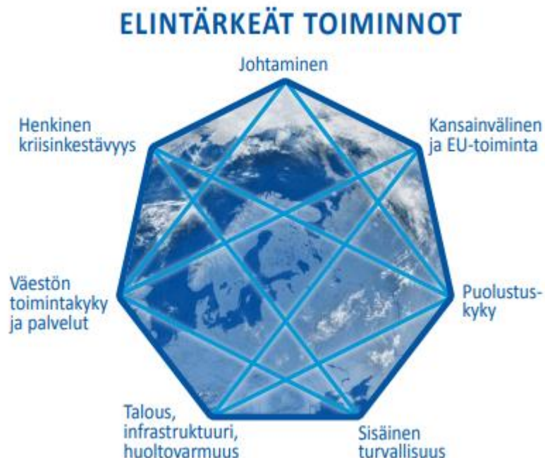
Kuva 2. Yhteiskunnan elintärkeät toiminnot; YTS 2017

Elintärkeät toiminnot ovat yhteiskunnan toimivuuden kannalta välttämättömiä, kaikissa tilanteissa ylläpidettäviä toimintokokonaisuuksia. Yhteiskunnan elintärkeät toiminnot ulottuvat useiden toimijoiden lakisääteisiin tehtäviin ja osin alueille, joille ei voida määritellä yhtä ainoaa vastuutahoa.